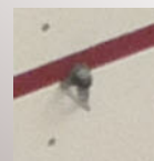
NON A LA LIGNE ROUGE !