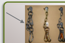
Option : moulinette avec mousquetons séparés

D'un point de vue pédagogique, la ligne rouge ne met pas les utilisateurs en situation d'évaluer le danger de ne pas mousquetonner le premier point d'assurance car la ligne rouge n'existe pas en milieu naturel. De plus elle augmente le blocage psychologique des enfants ayant une appréhension naturelle et les empêche d'aller plus haut !